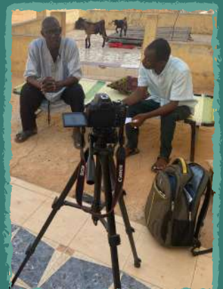
Nos jeunes journalistes en action