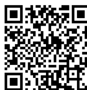
La Une des territoires vidéo du Gorgol

Les « Une des Territoires » mettent en lumière les initiatives et défis spécifiques à chaque région, en valorisant les personnes qui y vivent et travaillent. Chaque édition comprend deux volets : une partie vidéo, réalisée par des jeunes formés au journalisme citoyen, capturant des témoignages et des images sur le terrain, et une partie écrite, comme cette « Une » qui propose articles, interviews et sections ludiques.